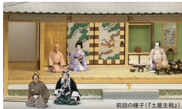
グランシップチケットセンター tel.054-289-9000 前回の様子(『土屋主税』)

■中ホール・大地 ■11:00~、14:30~ ■一般4,200円、子ども・学生1,000円 前半は、歌舞伎俳優による親しみやすい解説で、歌舞伎の魅力をわかりやすく紹介。後半は本格的な歌舞伎の名作を鑑賞。歌舞伎を初めて観る方、学生の皆さんにおすすめ。