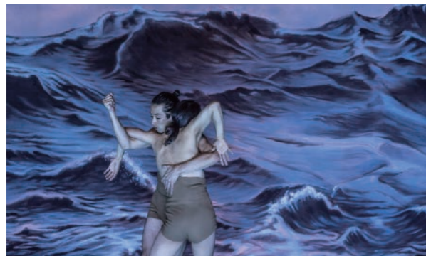
グランシップチケットセンター tel.054-289-9000

STILL LIFE ■中ホール・大地 ■19:00~ ■一般6,000円 子ども・学生1,000円 二人のダンサーの肉体と声、神秘的なコースが結びつき、人間と自然の関わりを描き出すダンスステージ。神戸で生まれ、ヨーロッパ各地で高い評価を得た作品が再び日本の地へ。 〈出演〉森山未来、ダニエル・プロイエット 他