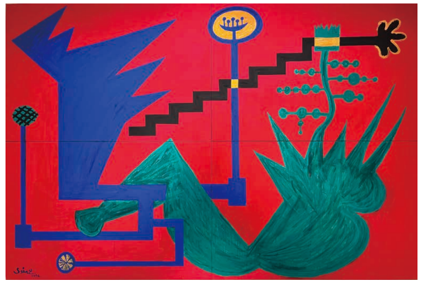
心を伝え合う二人