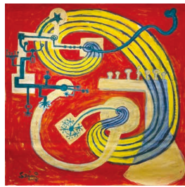
ゆめのめはまわりながら