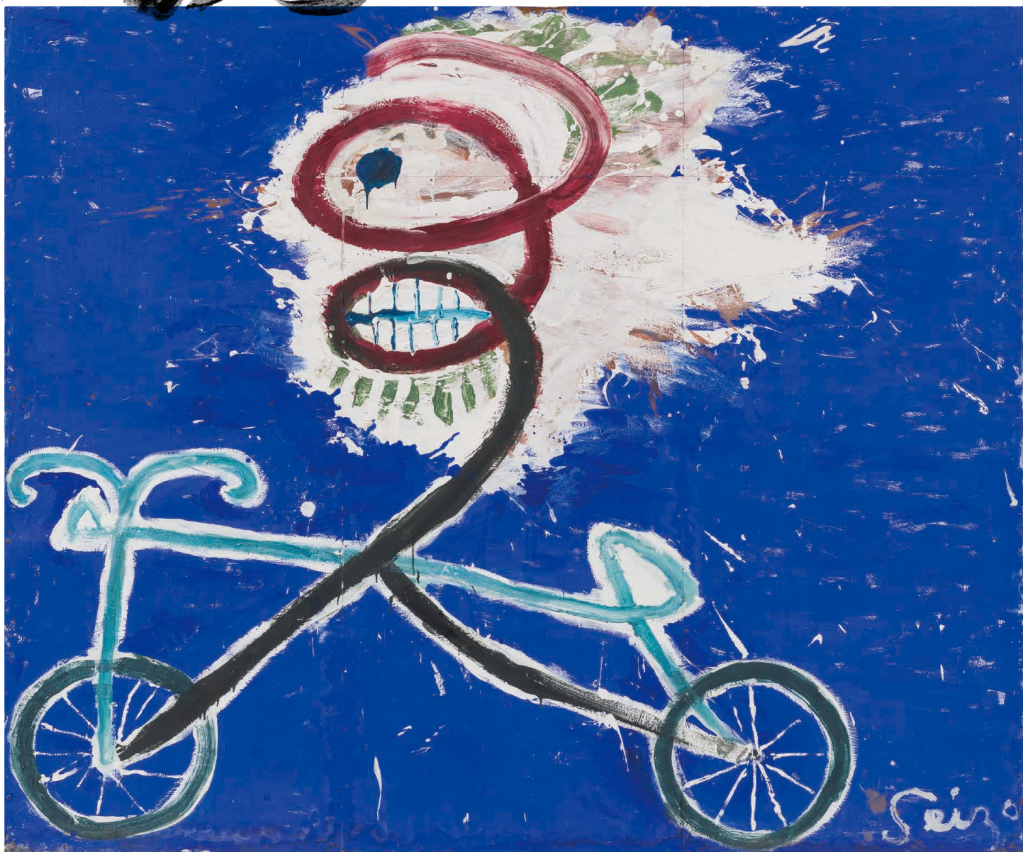
自転車の男