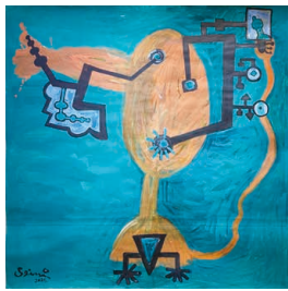
男にはとらわれないうめ