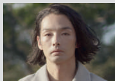
森山未来 Mirai Moriyama