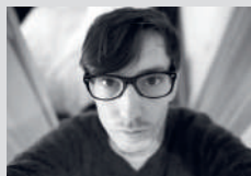
アラン＝ルシアン・オイエン Alan Lucien Øyen

出演：森山未来／ダニエル・プロイエット／青葉会スベリオル&男声合唱団 演出・振付・テキスト：アラン＝ルシアン・オイエン 美術・衣裳：アイダ・ヴァイニエリ／アラン＝ルシアン・オイエン 音楽：ヘンリック・スクラム 音響：マティアス・グロンスダル 照明：マーティン・フラック STILL LIFE © 2024 winter guests / Alan Lucien Øyen