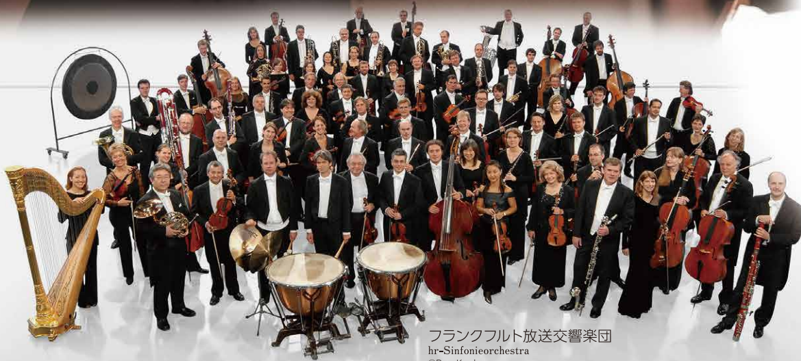
フランクフルト放送交響楽団 hr-Sinfonieorchestra

マーラー: 交響曲第5番 嬰ハ短調 Mahler : Symphony No.5 in C-sharp minor